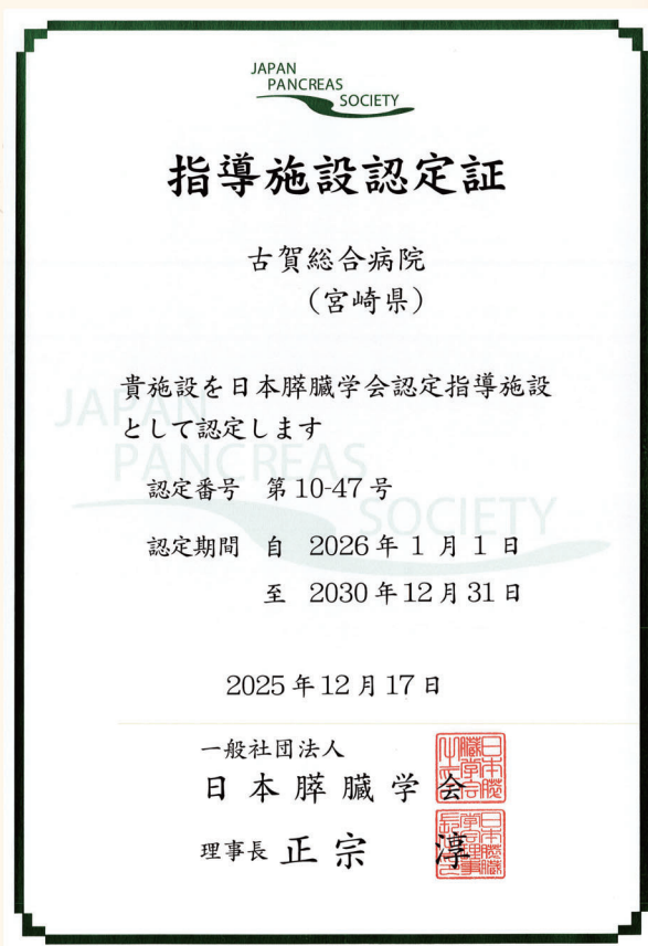
図1 日本膵臓学会指導施設認定証