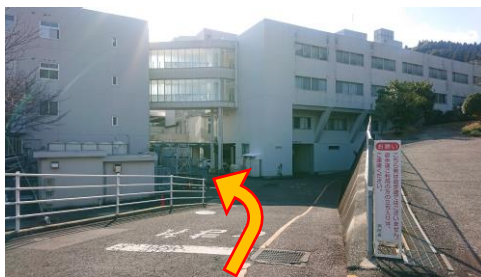
直進して左折してください