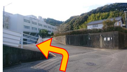
左折してください （左折後、右側は私道ですのでご注意ください）