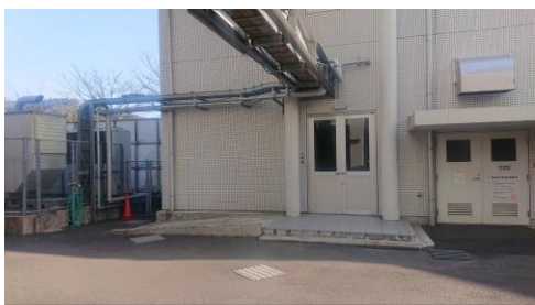
産婦人科病棟地下入り口の前で待機ください