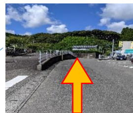
直進してください