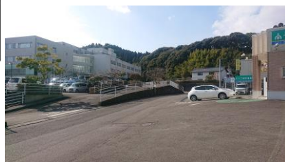
ここで、「着きました」と 0985-39-0036 にご連絡ください